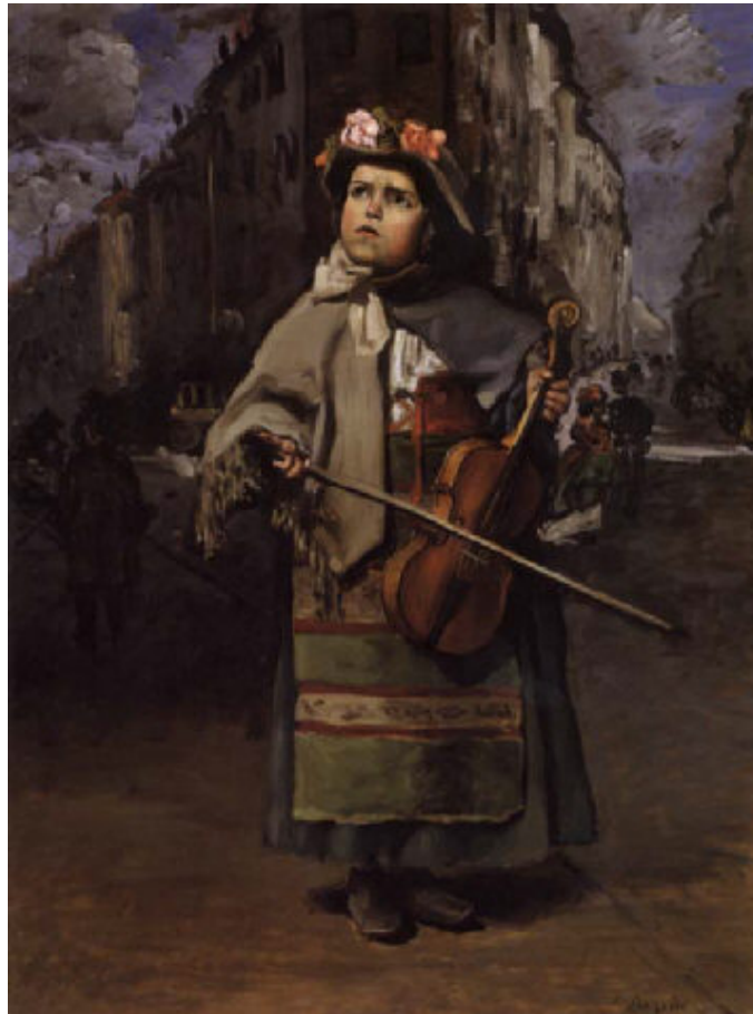
Tablèu n°2 : Frédéric BAZILLE, (Montpellier, 1841 - Beaune la Rolande, 1870), Petite Italienne chanteuse des rues , 1866, òli sus tela. Musèu Fabre - Montpelhièr Aglomeracion.