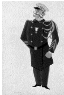
ill.1- Jean Hugo Etudes de costume pour « Les mariés de la Tour Eiffel », 1921 Collection particulière Droits réservés